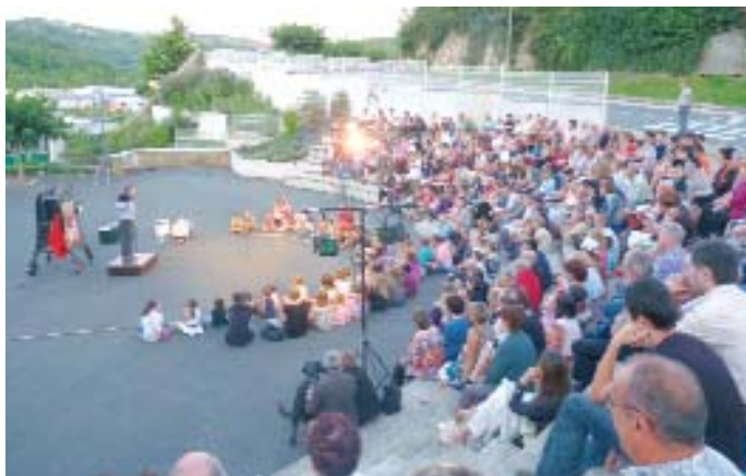
Photo L'été des 4 jeudis - Bump, Cie Histoire de Famille.